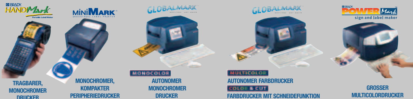
TRAGBARER, MONOCHROMER DRUCKER