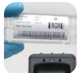
Kennzeichnung im Labor und Gesundheitswesen