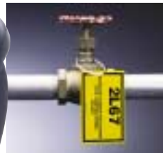
Schriftgröße von 2 mm bis 42 mm