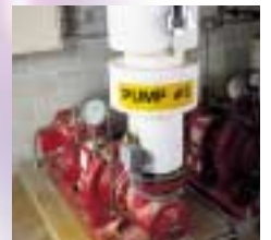
Alphanumerisch fortlaufender Seriendruck